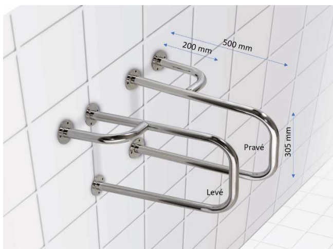
Kombinovaný úchyt k umyvadlu