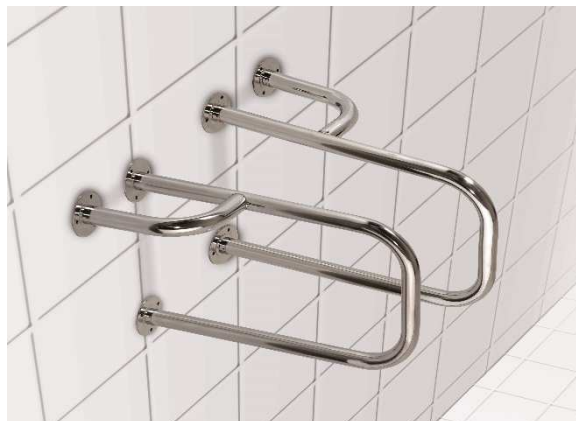
Kombinovaný úchyt k umyvadlu