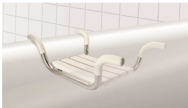
Sedátko do vany