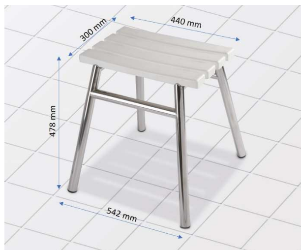
Stolička do sprchy