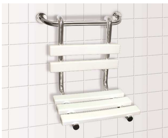
Sprchové sedátko závěsné