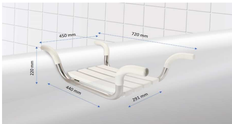
Sedátko do vany