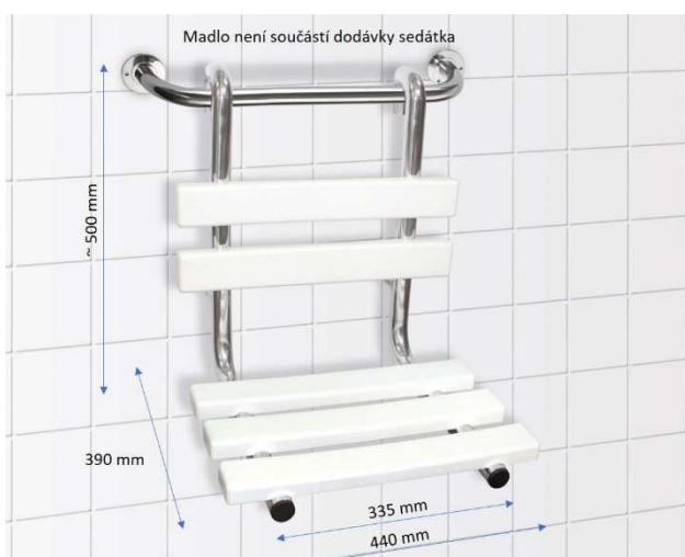
Sprchové sedátko závěsné