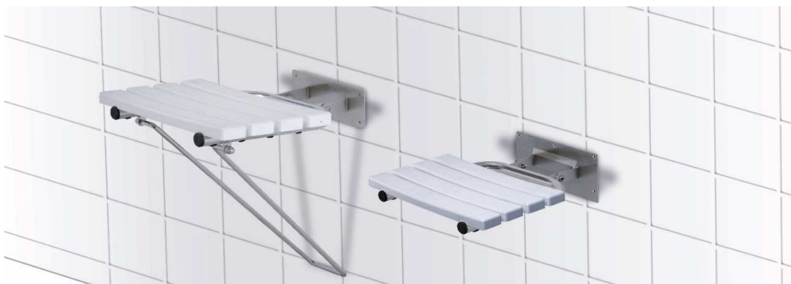
Sprchové sedátko závěsné sklopné