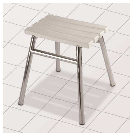
Stolička do sprchy