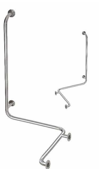
Rohové madlo do sprchy s opěrou