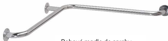
Rohové madlo do sprchy

Madlo ve sprchovém koutě je mnohdy nezbytnou pomůckou k bezpečnému pohybu pro obtížně se pohybujícího člověka. Zejména kluzké prostředí sprchy ke prostředí se zvýšeným rizikem uklouznutí. Madlo ve sprše mnohdy ocení všichni, bez rozdílu pohyblivosti. Madla do sprch se vyrábí ve dvou variantách, rohové madlo či rohové madlo s opěrou.