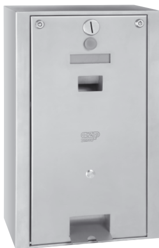
C – EL. PŘÍVOD